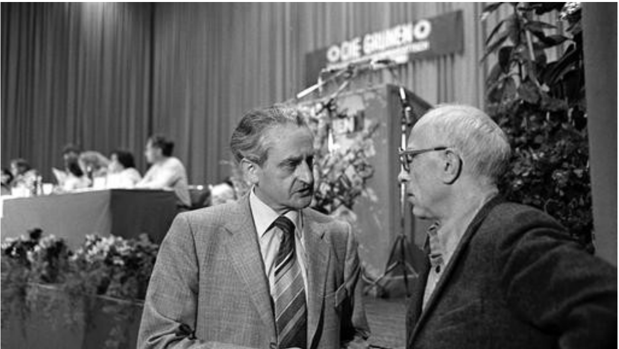
Herbert Gruhl und Carl Amery bei den GRÜNEN